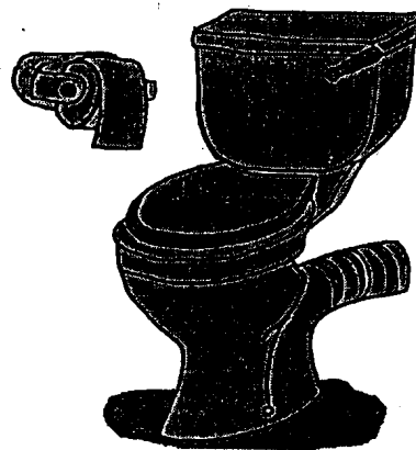
แบบส้วมนั่งราบ